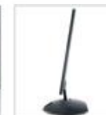
Стильный тонкий корпус толщиной всего 1,29 см