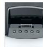
Удобные клавиши и меню

Интеллектуальный 23" (58,5 см) дисплей AOC myStage адресован поклонникам продукции Apple® и обеспечивает возможность прослушивания музыки, просмотра фотографий и видеозаписей, а также роликов YouTube с помощью iPhone и iPod без использования ПК. А подключив монитор к компьютеру, пользователи смогут выполнить синхронизацию своей музыкальной библиотеки, загруженных из Интернета файлов и данных офисных приложений, а также прослушивать музыку на его встроенных динамиках мощностью 5 Вт. Это мощное мультимедийное решение для владельцев смартфонов и планшетов компании Apple.