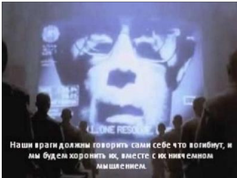
Рекламный ролик Macintosh

к акционерам компании Apple Computer. У него была яркая улыбка, безукоризненная речь, когда