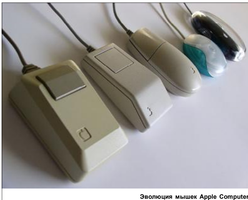
Эволюция мышек Apple Computer

Первый прототип мыши состоял из шарикового дезодоранта и масленки. Готовая мышка с одной кнопкой ввода плавно перемещалась по любым поверхностям и