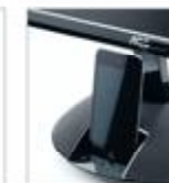
Док-станция для подключения iPhone/iPod